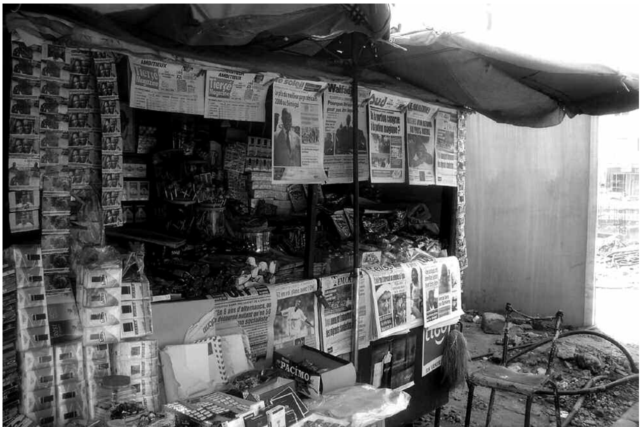
Kiosque à Dakar où pendent les nombreux quotidiens