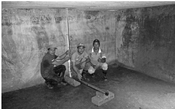
Légende: installation du système de pompage solaire

Pour améliorer le système et faire des économies, nous avons construit un système de récupération de l'eau de pluie, qui la concentre dans un grand réservoir. L'eau doit ensuite être pompée vers des réservoirs situés en hauteur, pour pouvoir donner de la pression au réseau d'eau.