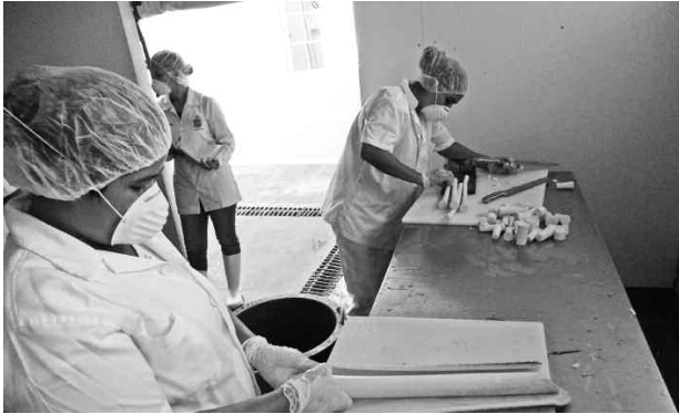
Photo: préparation cœur de palmier