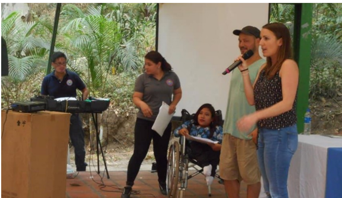
L'Assemblée nationale de l'organisation Los Angelitos en décembre 2019