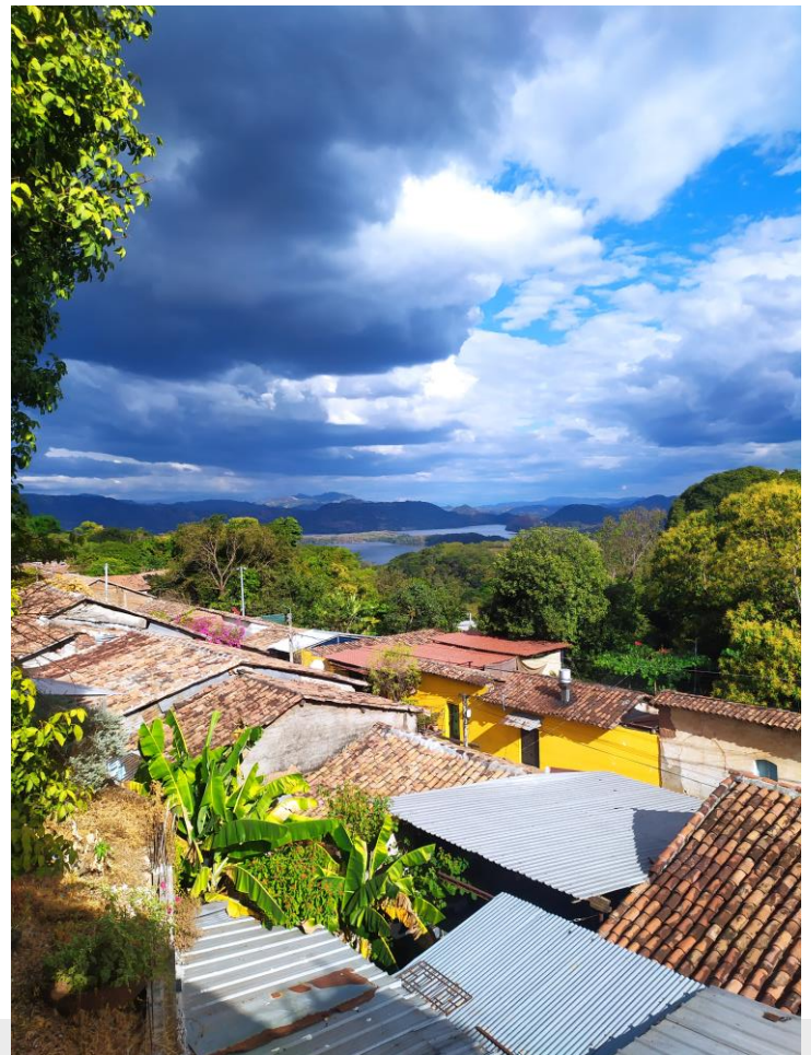
Vue depuis ma terrasse

Deuxième jour de l'année, j'ai eu l'opportunité d'emménager dans une super maison, avec une vue incroyable sur le lac, en plein centre de Suchitoto !