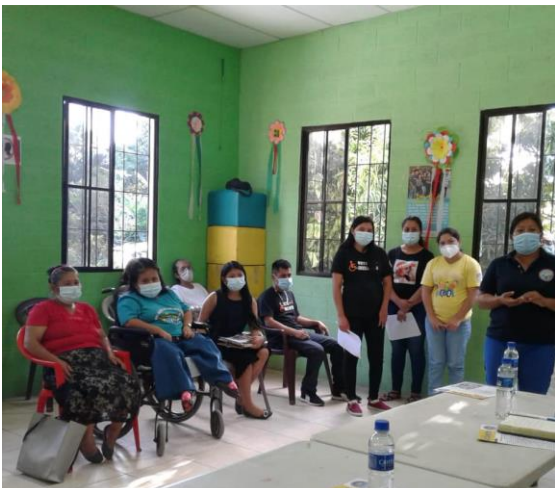
Présentation de la Plateforme de revendications aux candidats de Santa Cruz Michapa.

Dans le cas des mairies, par exemple, la loi d'inclusion les oblige à allouer un budget spécifique, dans leurs comptes annuels, pour la prise en charge des personnes en situation de handicap, ce qui n'était pas le cas auparavant. En ce sens, bien que symbolique, la signature des différent·e·s candidat·e·s est considérée comme une « promesse » d'engagement à partir d'un document rédigé sur une base légale.