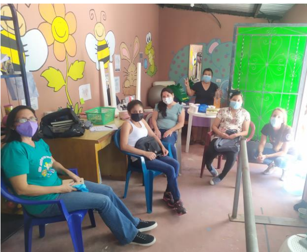
Réunion de jeunes, Santa Cruz Michapa

Pour commencer, nous allons développer trois groupes, dans trois communes du département. Pour ma part, je suis garante de l'avancée du projet et de sa réalisation. Les ateliers et thématiques sont répartis, selon les compétences de chacun, entre mes collègues et moi. Pour certains sujets, un intervenant extérieur sera engagé.