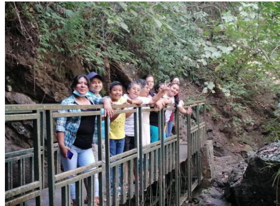
Partie de l'équipe de los Angelitos