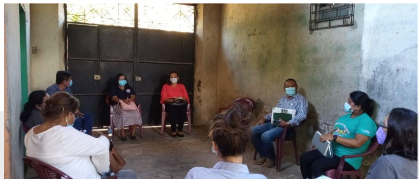
Présentation de la Plateforme de revendications aux candidats de Tenancingo

Nuevas Ideas divise au sein de la population, mais selon les sondages, il ne serait pas impossible que le parti puisse devancer ses concurrents et gagner la majorité des sièges à l'assemblée législative et obtenir ainsi le pouvoir.