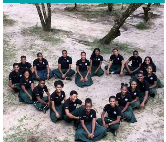
Génération de Finalistes, 2017 ©Ethel Taylor, PLACE