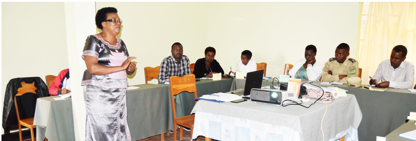
Formation sur la gestion non-violente des conflits auprès des gardiens de la prison de Huye, Rwanda

Dans la zone des Grands Lacs africains, Eirene Suisse collabore avec des partenaires présents dans trois pays : l'Ouganda, le Rwanda et la République Démocratique du Congo. Dans une région pourtant très interconnectée, l'éducation à la paix et la gestion des conflits s'effectuent de manière différente en fonction du pays dans lequel on se trouve. En effet, lorsque l'on travaille avec des populations ayant traversé de nombreux traumatismes, il est crucial d'intégrer les interventions dans le contexte historique, social et géopolitique local.