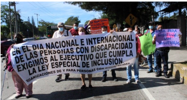
Manifestation du 3 décembre 2021 : « Nous exigeons que l'exécutif applique la Loi Spéciale d'Inclusion. »

L'entrée en vigueur de la « Loi Spéciale d'Inclusion » en janvier 2021 n'a rien changé au quotidien des personnes en situation de handicap. Le gouvernement n'a pas divulgué son contenu au public, ni rédigé les règlements nécessaires à son application. Il n'y a ainsi aucune information de la part de l'État concernant la portée de cette Loi relative au handicap.