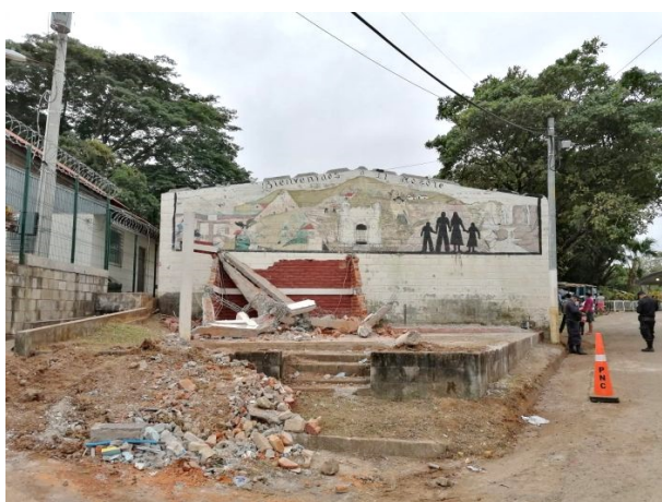
Destruction du monument aux victimes du massacre du Mosote

Selon le Président du Salvador, l'un de ses objectifs est : « le démantèlement de l'appareil idéologique de l'opposition ». Les symboles et les souvenirs de la lutte du peuple salvadorien, notamment certains monuments, ont ainsi été détruits.