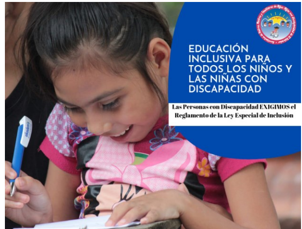
« Éducation inclusive pour tout·e·s : les personnes en situation de handicap exigent le règlement de la Loi Spéciale d'Inclusion »

Malgré les mesures répressives, les organisations liées au secteur du handicap ont manifesté à plusieurs reprises pour faire pression sur les institutions gouvernementales, notamment le 3 décembre 2021, lors de la journée internationale des personnes en situation de handicap. Un comité a été reçu par le personnel juridique de la Présidence pour présenter leurs exigences... Une demande restée à ce jour sans réponse !