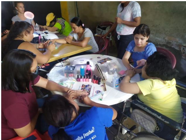
Durant une matinée de travaux pratiques sur un modèle