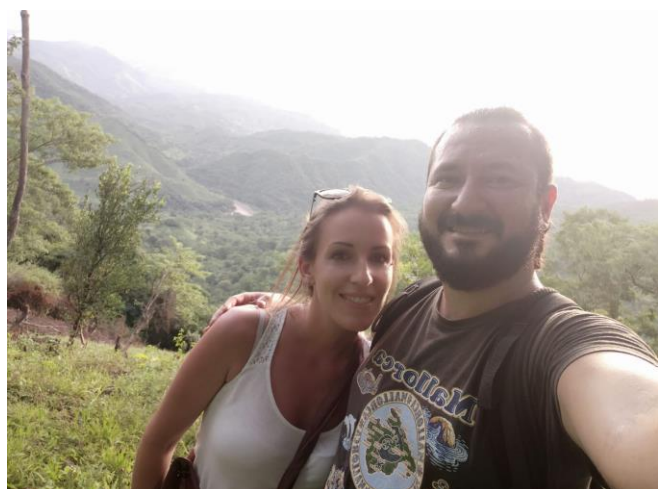
El Carrizal, Chalatenango