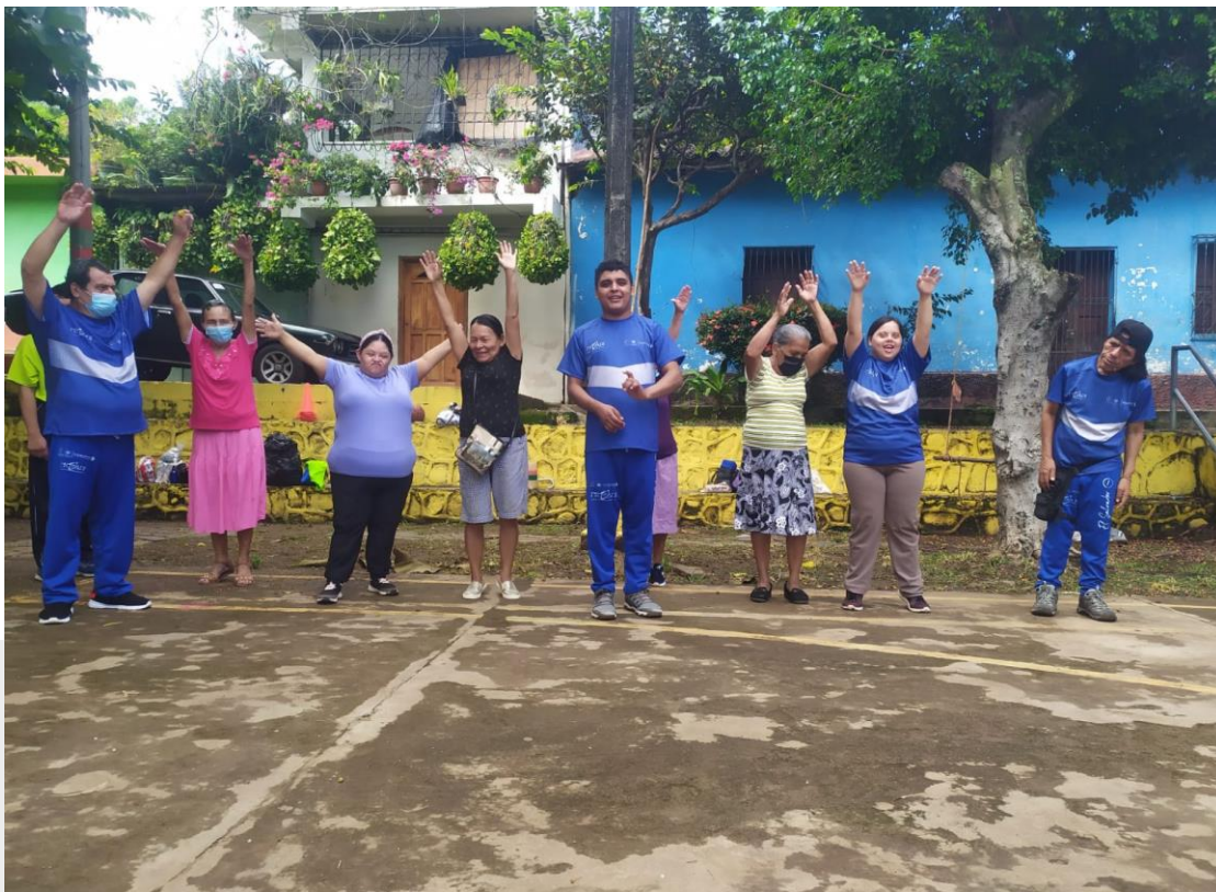
Échauffement en groupe à Suchitoto

Le 8 septembre, un festival sportif, organisé par l'INDES a eu lieu à Cojutepque, la capitale du département de Cuscatlán, réunissant 65 enfants et jeunes en situation de handicap, provenant de tout le département, afin de participer à des activités sportives et ludiques. 15 jeunes de l'association y ont participé, super motivés.