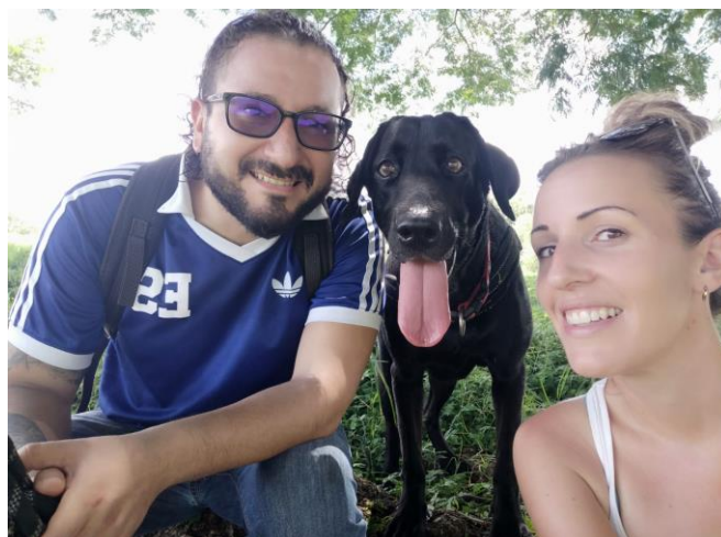
Aguas calientes, Suchitoto