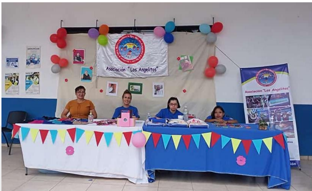
L'équipe présente durant le festival du Tamal, à San Pedro Perulapán