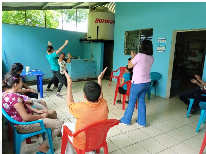
Groupe de réflexion de San Francisco Echeverria, durant un exercice sur les émotions

Durant l'activité de groupe du mois dernier, les mamans ont été invitées afin de partager un moment convivial tout-e-s ensemble. Ces dernières ont exprimé leur étonnement quant à la volonté et l'aisance avec lesquelles leur enfant se présentait devant le groupe. C'est durant ce genre de moments, que ce projet prend tout son sens.