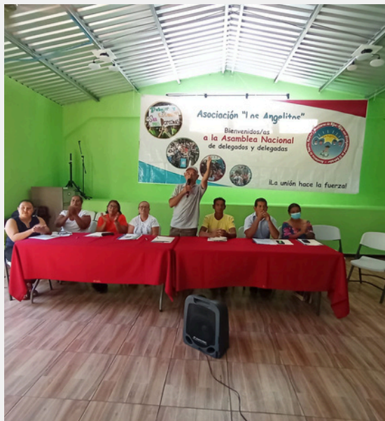
Reunión anual de Los Angelitos a finales de diciembre

Fundada en 2004 por padres de niños y jóvenes con discapacidad, Los Angelitos lucha por el cumplimiento de las leyes vigentes y los derechos humanos con el objetivo de lograr una sociedad inclusiva. En la actualidad, Los Angelitos cuenta con 700 familias asociadas y actúa en 24 comunidades de 5 regiones del país.