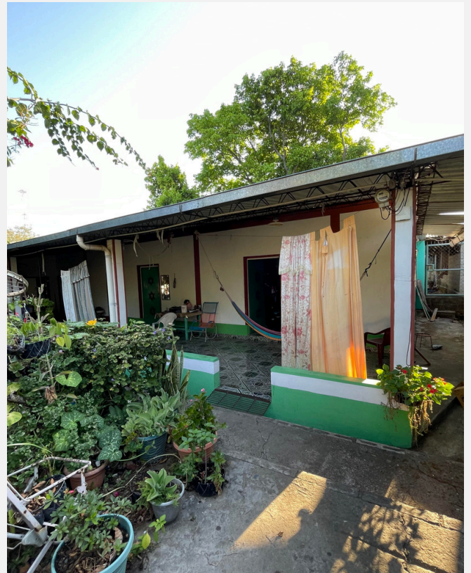
La casa dónde vive Joël