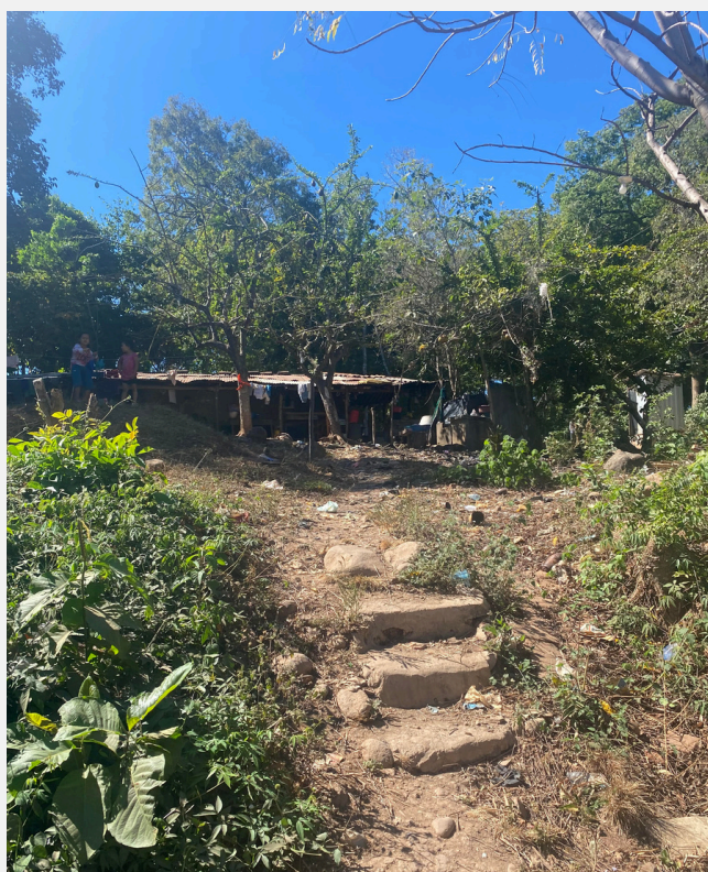
Casas de familias que trabajan con Los Angelitos.

Gracias por tomarte el tiempo de leer estas líneas.