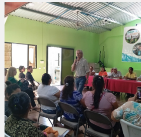
SOBRE LAS ORGANIZACIONES