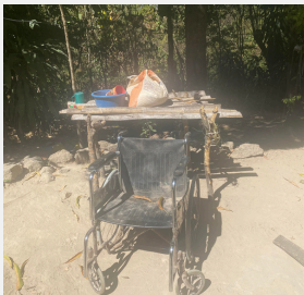
CONTEXTO DE LAS PERSONAS CON DISCACIDAD