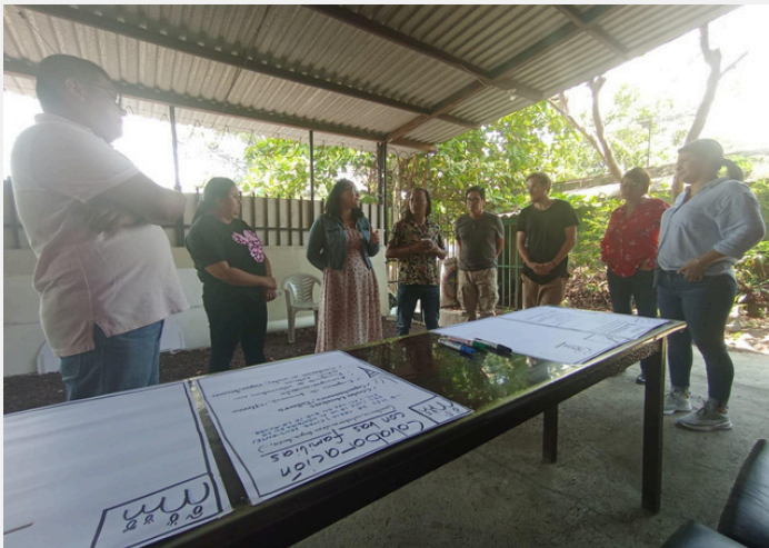
Capacitación interna sobre el tema "trabajo con planes educativos".