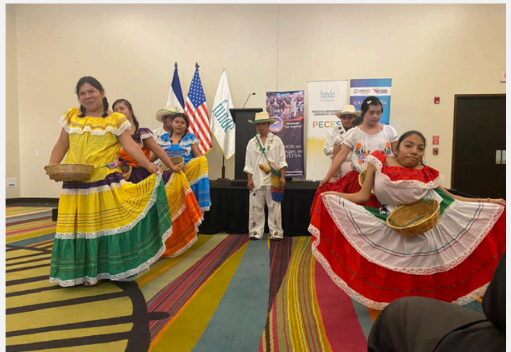
El grupo de danza Los Angelitos de Cuscatlán en el foro

Inspiradora imagen simbólica de la diversidad de todos nosotros