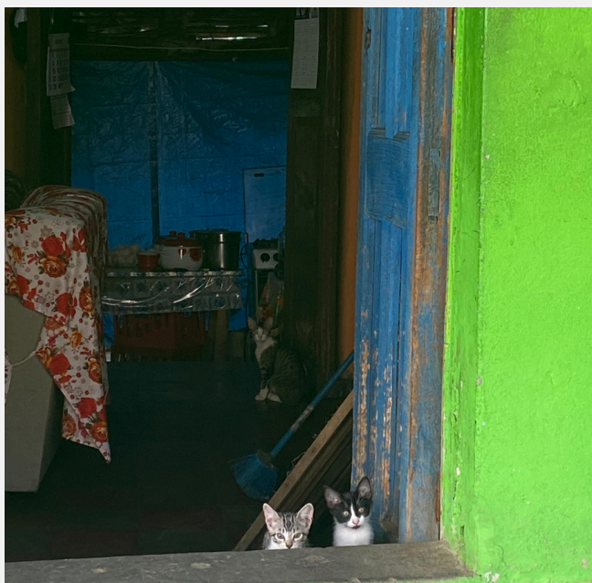
Vecindario en Suchitoto