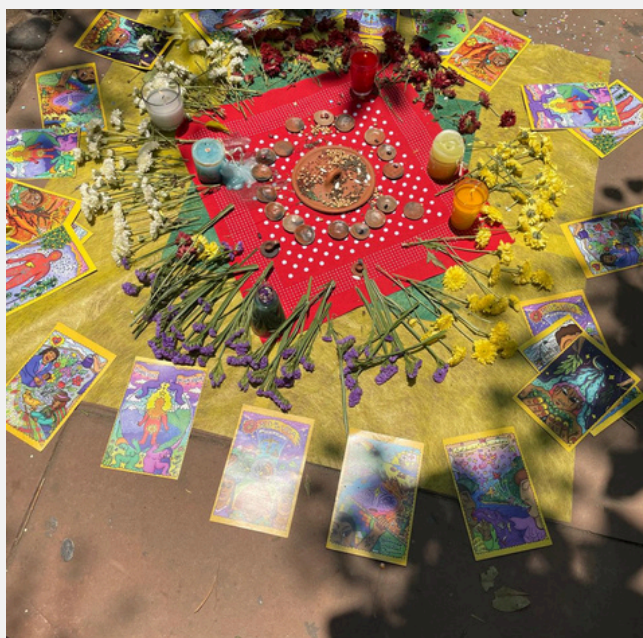
Altar de gratitud en las calles de Suchitoto

Gracias por tomarse el tiempo de leer estas líneas.