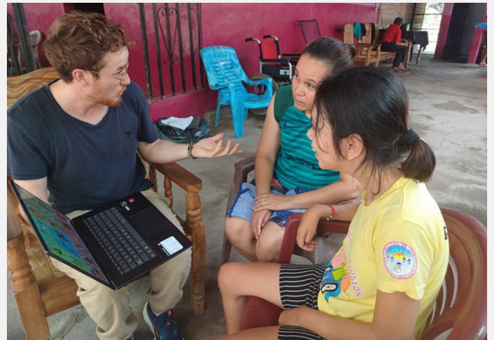
Asesoramiento a una familia sobre el tema "Comunicación aumentativa y alternativa"