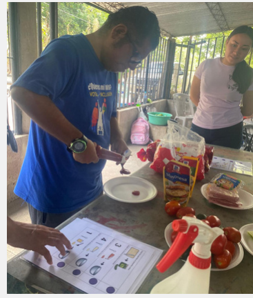
Preparación del refrigerio