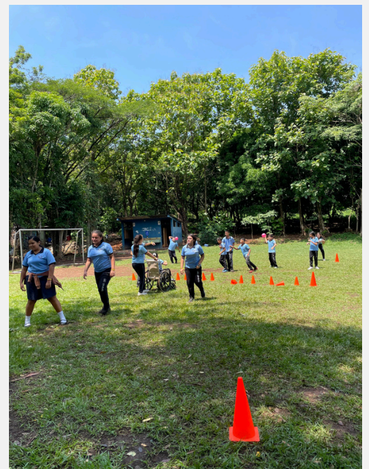
Curso sobre el tema "Educación física inclusiva"

También trabajaré en ello en los próximos meses: