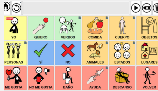
Aplicación personalizada para la comunicación