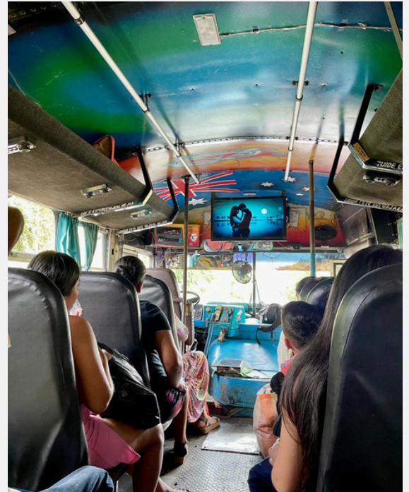
Viendo videos de canciones en el bus

Comunicación: Si dices algo y la otra persona no lo escucha o no lo entiende, dice: "¿Hola?".