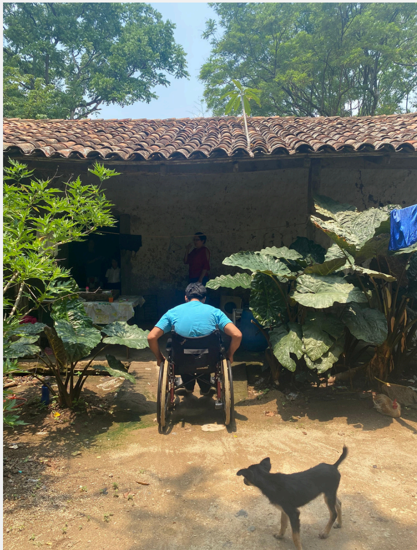
Visita al hogar de un joven de Los Angelitos en Tenancingo