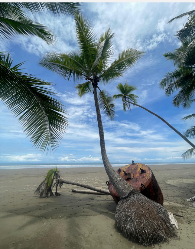
Un día bajo las palmeras