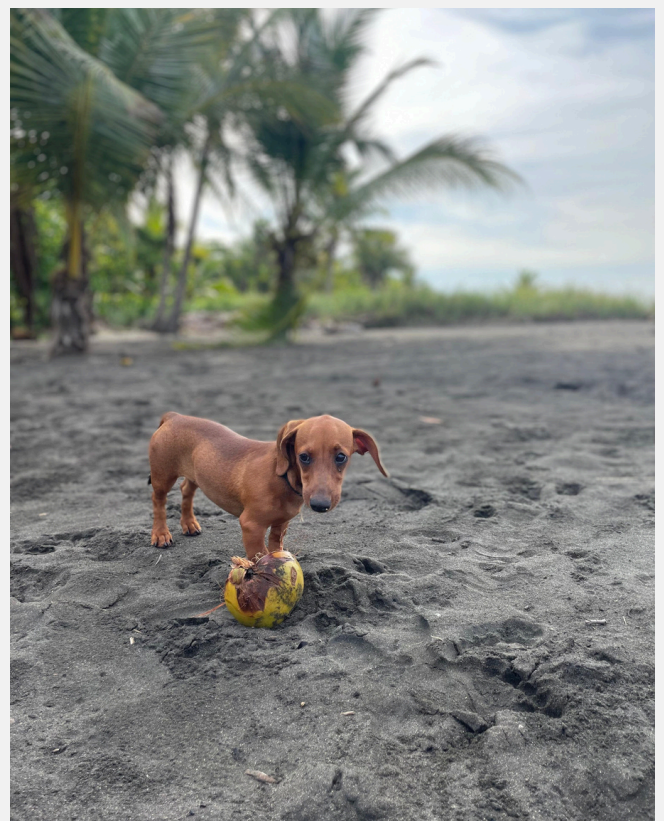
Nuna con un coco