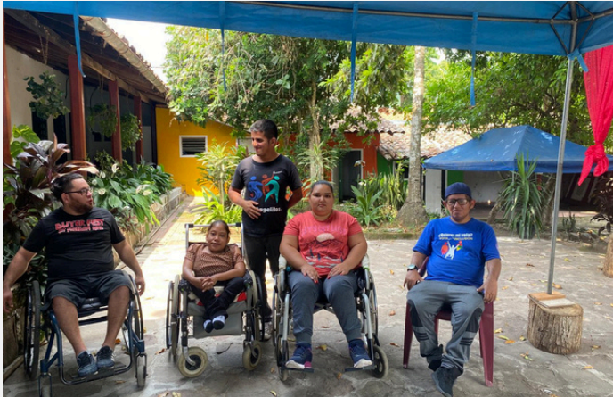
El comité de jóvenes de Los Angelitos