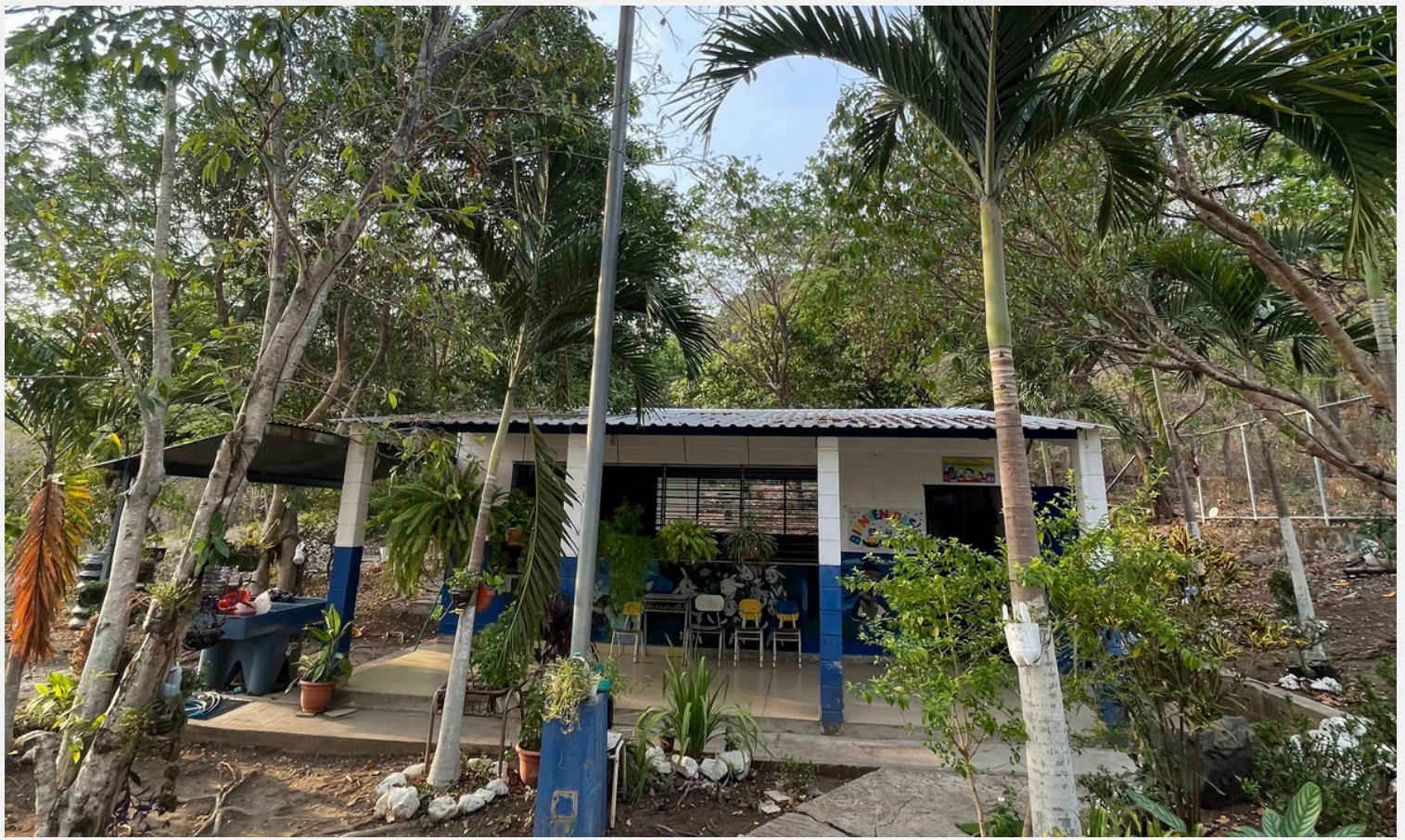
Kínder en Potrero Sula