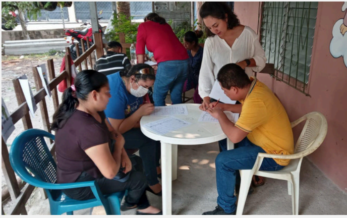
Taller de aprendizaje in Santa Cruz Michiapas