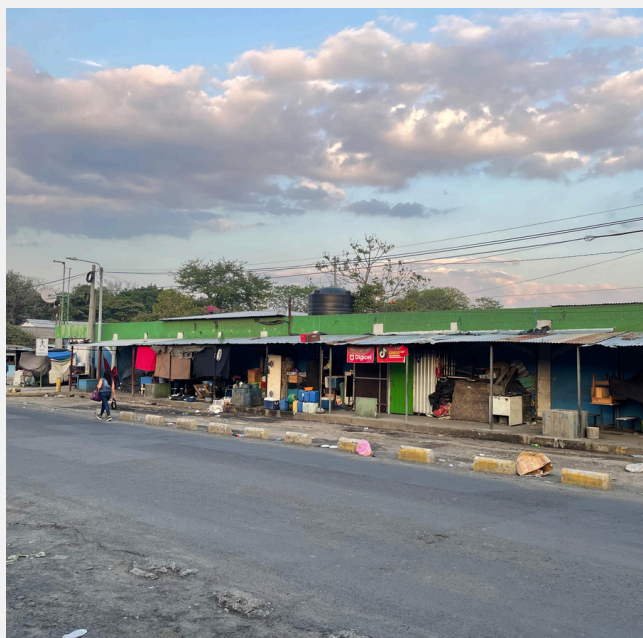
Terminal de buses en San Salvador