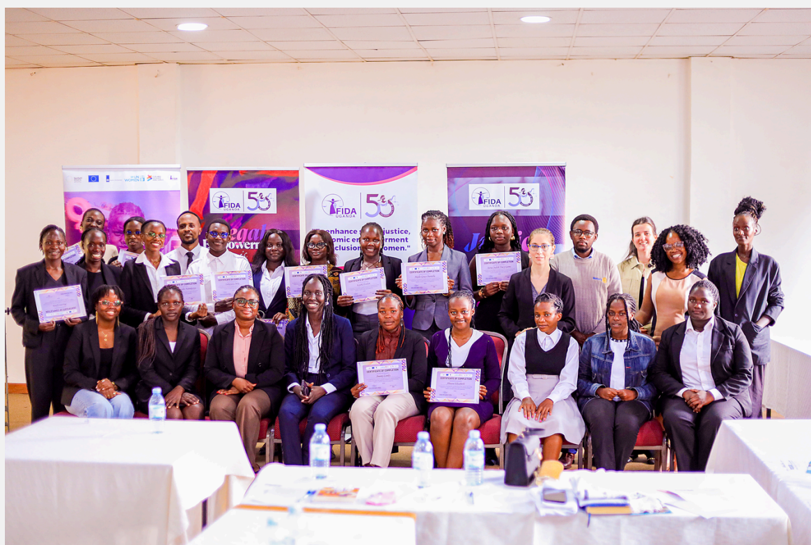
Remise de diplômes du programme de mentorat, 28 avril 2026

En mai, j'ai pris part à une réunion de réflexion sur les programmes des régions de Karamoja et West Nile, en présence des équipes locales. Nous y avons passé en revue deux programmes terminés ou en voie d'achèvement, et avons discuté des futurs projets. J'ai été absolument impressionnée de voir tout ce qui est accompli par les équipes locales, et de la détermination dont elles font preuve dans des situations parfois difficiles.