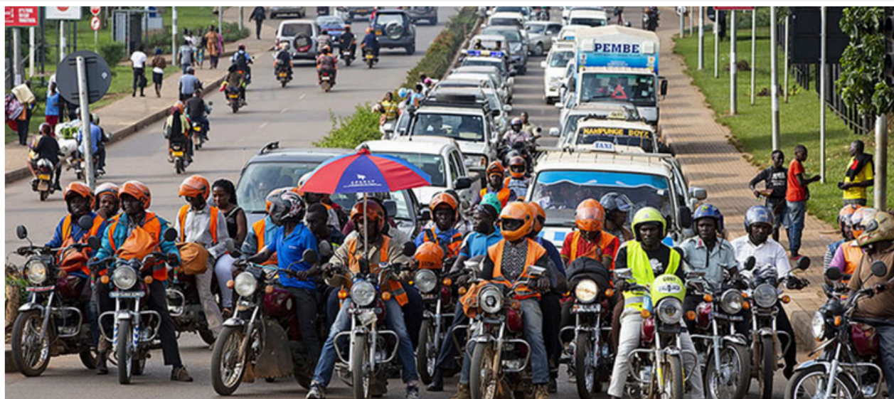
Boda-bodas au carrefour

Les feux rouges semblent n'être qu'une simple suggestion pour la marée de motos, sauf aux grands carrefours où le spectacle est saisissant. Une ligne de boda-boda se forme à l'arrêt – vingt, trente motos, parfois même facilement cinquante – et devant les voitures immobilisées, ils constituent un mur vivant qui cache la circulation derrière.