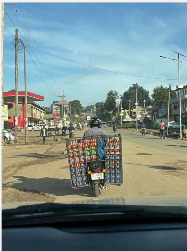
Transport d'oeufs à boda-boda

C'est lors de ce trajet que j'ai eu l'impression de vraiment voir la ville pour la première fois. Sur un boda, on est dans Kampala, on sent l'air, le bruit, les odeurs, on voit la vie de la ville. Tout autant qu'on traverse la ville, c'est elle qui nous traverse.